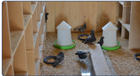
Blick in den Innenraum eines Taubenhauses

Dieses Infoblatt wurde herausgegeben durch: Kreisverwaltungsreferat München – Stadttaubenmanagement Ruppertstraße 19 80466 München E-Mail: taubenmanagement.kvr@muenchen.de Internetseite: www.muenchen.de/stadttauben