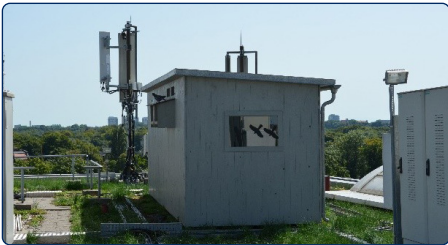
Betreutes Taubenhaus auf einem Flachdach

Bei Fragen können Sie sich auch direkt an das Stadttaubenmanagement im Kreisverwaltungsreferat unter taubenmanagement.kvr@muenchen.de wenden. Wir beraten Sie gerne zu Taubenhäusern oder möglichen Alternativen.